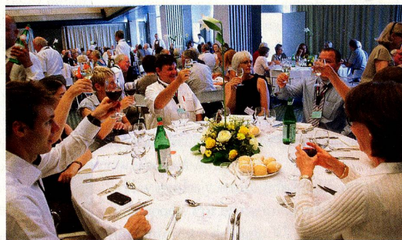
Animada charla en grupo durante el amuerzo del sábado