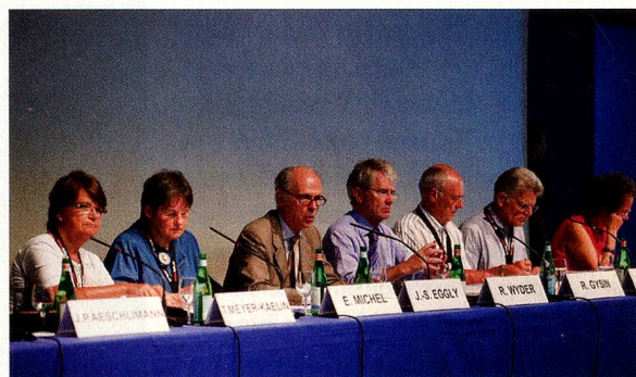
La Directiva de la OSE durante la reunión del Consejo de Suizos en el Extranjero