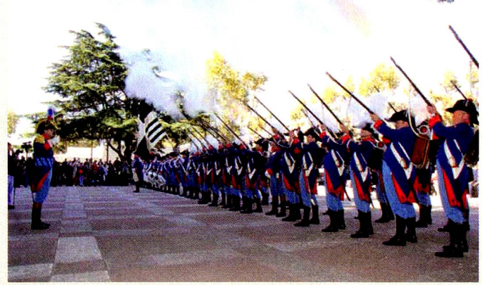
Salva de honor frente a la Intendencia de Colonia

Por otra parte, la colaboración del Cantón de Friburgo y la Embajada de Suiza con el Municipio de Nueva Helvecia permitirá la construcción de un policlínico barrial en el Barrio Retiro.