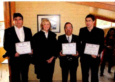
Homenaje a los fotógrafos locales

nuestros antepasados, como el sentido de la responsabilidad que ha sido el legado más importante que ha influido en mi vida"; manifestó el artista visual.