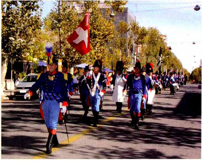
Los Granaderos en el desfile cívico-militar en Nueva Helvecia