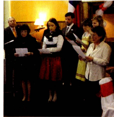
Momento del Himno Suizo

El sábado 4 de agosto se celebró la Fiesta Nacional Suiza en los salones del Club Suizo de Magallanes; asistieron cerca de 150 personas entre socios del Club, descendientes de suizos friburgueses y amigos de la colonia suiza. La celebración comenzó en el Himno Nacional de Chile y a continuación el Himno Nacional de Suiza, que fue acompañado en coro por integrantes del Círculo Suizo.