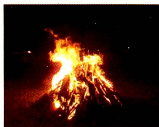
La gran fogata

Los deseos de los niños también se cumplieron con satisfacción: una gran fogata (aunque algunos sufrimos picaduras de hormigas), una caminata con los faroles, cuando ya nos olvidamos de la picazón, canciones y por fin unos lindos fuegos artificiales. Este punto del programa fue apreciado por todos. Después de recoger sus premios de la tómbola y de la música que empezó sonar en vivo, los padres con niños pequeños se retiraron y siguió la parte de los ani-