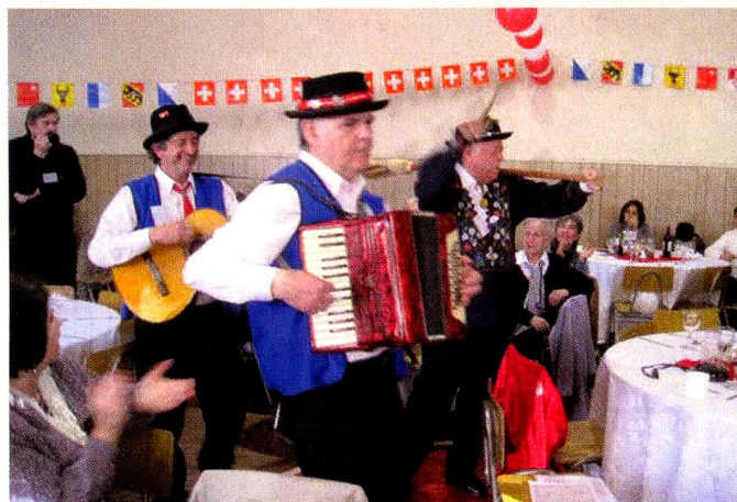
La música alegró el encuentro en Traiguén.

Rousseau fue filósofo, educador, autor, músico y naturalista a la vez, fue también revolucionario y uno de los padres del pensamiento democrático moderno. En una de sus obras llamada El contrato social, aborda muchos de los conceptos que