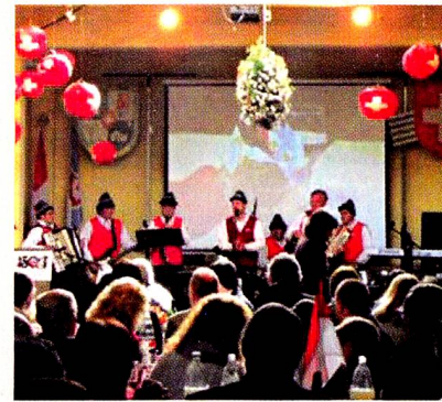
Centro Helvético-5 de agosto

El domingo 5 de agosto, en el marco de los 150 años de la Colonia Suiza y los 721 años de la Confederación Helvética, se realizó el Acto Inauguración de las