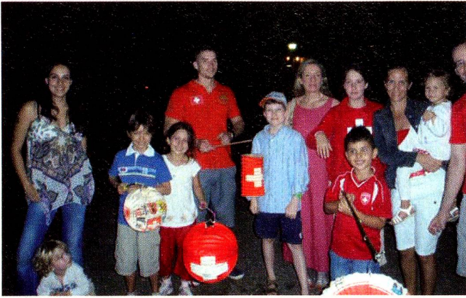
Los niños con sus faroles. En el centro, la Sra. Embajadora

amistades con los diferentes pueblos. Somos representantes en muchas ocasiones y no subestimamos nuestro aporte para un buen entendimiento entre culturas tan diferentes.