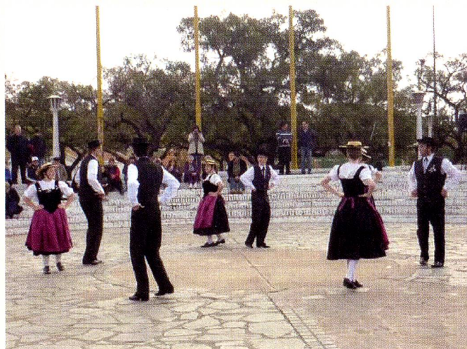
Cuerpo de Baile "Encantos Alpinos"

En su sede de la calle Lavalle 115 en la pintoresca ciudad de