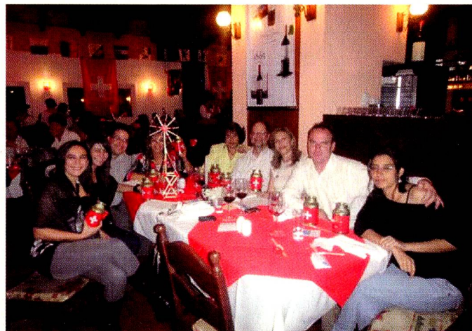
Algunos comensales. Sobre la mesa, el molino construido para la competencia

Con las vibrantes palabras grabadas de la Sra. Presidente del Consejo Federal y el tradicional brindis colectivo, este año se inició la reunión del 1º de agosto, a las 19 hs. Acto seguido, los participantes tuvieron la oportunidad de deleitar sus paladares con una succulenta cena a cargo del chef del Chalet