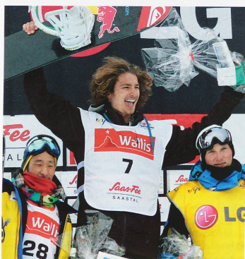
Iouri Podladtchikov en el podio de los vencedores y en la «half-pipe» de Saas-Fee en noviembre del año pasado

Iouri Podladtchikov se tutea con las grandes figuras americanas del snowboard. Este zurigués, subcampeón del mundo de half-pipe, consigue realizar, una tras otra, las figuras más impresionantes del circuito. Entrevistamos a este acróbata del circo blanco, después de su victoria en la Copa del Mundo de Saas-Fee. Por Alain Wey