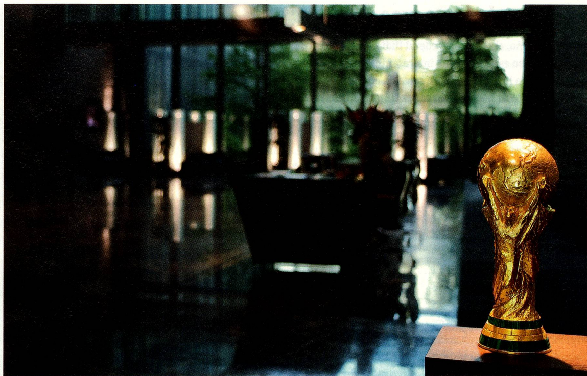
Vista del vestíbulo del «Home of FIFA» en Zúrich

pre había apoyado a Blatter. Este cambio de posiciones le costó su puesto en la FIFA. Para vengarse presentó inmediatamente documentos que demuestran que antes recibió varias veces del propio Blatter derechos televisivos de la FIFA por un precio simbólico de un dólar, como contrapartida por su apoyo a Blatter.