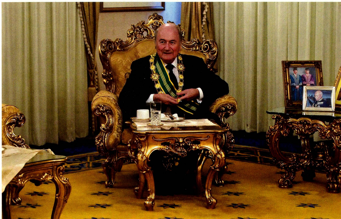
El Presidente de la FIFA, Joseph «Sepp» Blatter, como «First Class Grand Commander» en el Royal Pahang Palace de Kuala Lumpur en marzo de 2011

en sus negociaciones contractuales. En 2006, dos empresas de tarjetas de crédito americanas, VISA y Mastercard, se disputaron espacios publicitarios junto al campo de fútbol. Mastercard era un socio patrocinador de la FIFA desde hacía años, pero eso no les sirvió de nada. La FIFA negoció en secreto con VISA e incluso informó a ésta de las ofertas de Mastercard. No se trata de rumores, sino de hechos especificados en actas judiciales estadounidenses.