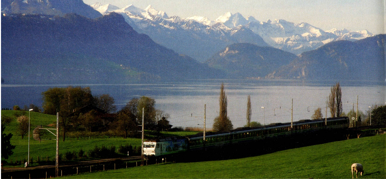
Expreso Prealpino, Suiza central