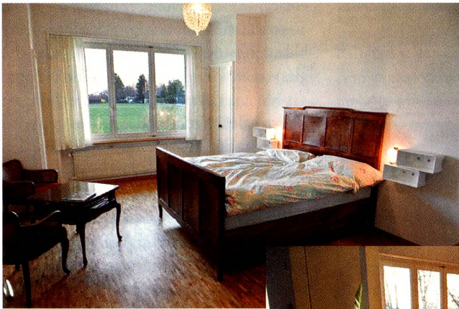
Im Klee, Bed & Breakfast, Melchenbühlweg 8, 3013 Berna +41 31 931 35 35 www.imklee.ch, schlafen@imklee.ch

sur, ofrecen una fantástica vista del panorama alpino, cuestan entre 75 y 130 francos por noche (individuales, respectivamente dobles, en caso de estancias más prolongadas hay descuentos). Dos habitaciones tienen agua corriente, las duchas y los servicios se encuentran en el mismo piso. Hay aparcamientos delante de la casa y los transportes públicos y el famoso restaurante «Schöngrün» están a muy poca distancia. BE