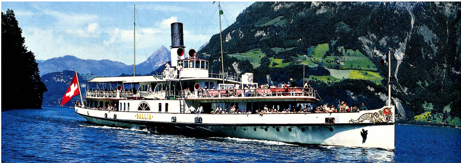
Wilhelm Tell Express en el Lago de los Cuatro Cantones, Suiza Central