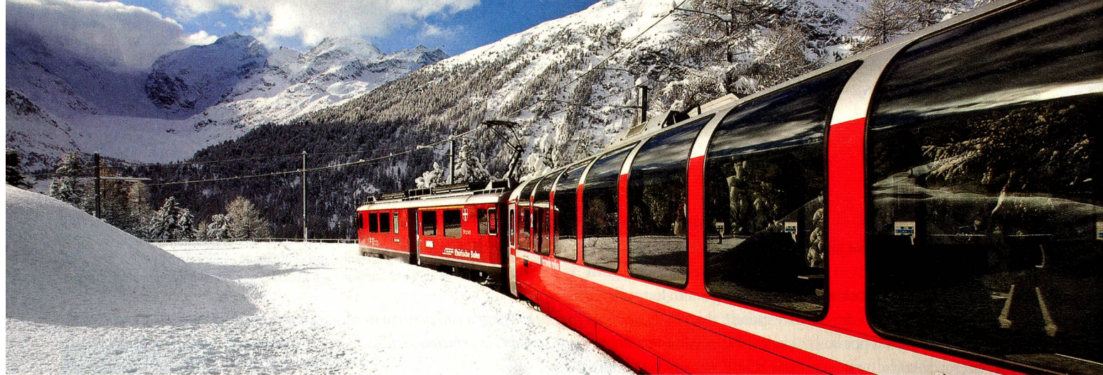
Bernina Express cerca del Lago Bianco, Grisones