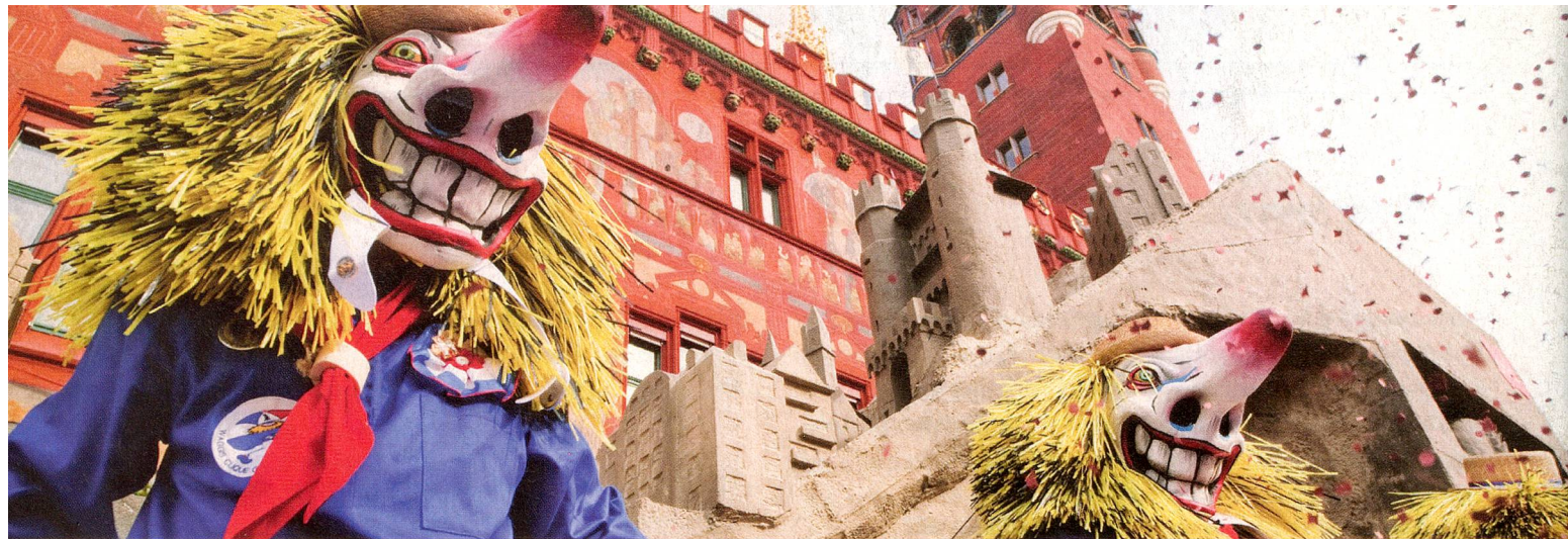
Carnaval de Basilea, Basilea Región