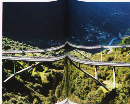
El Ponte Nanin y el Ponte Casella en Mesocco, fotografiados por Ralph Feiner en 2009