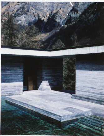
El nuevo edificio de las Therme Vals, del arquitecto Peter Zumthor, inaugurado en 1996