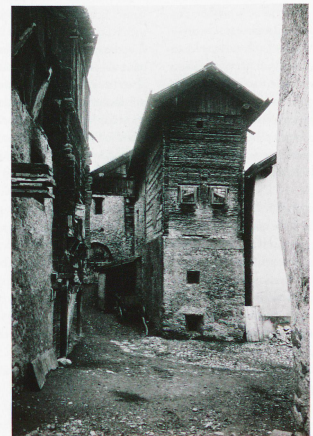
Edificio de viviendas en Zuoz