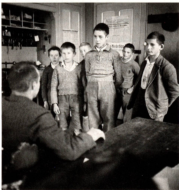
ntes ciudades de Suiza