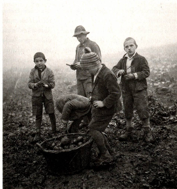
Imágenes de niños explotados tomadas por Paul Senn en los años cuarenta, que se pueden ver en la exposición «Verdingkinder reden - Enfances volées» en diferido