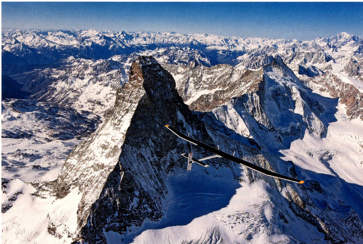
La HB-SIA en un vuelo por encima de Zermatt