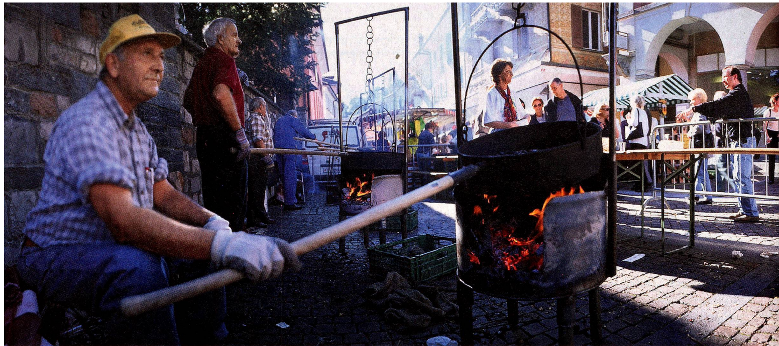
Castagnata, Ascona, Ticino