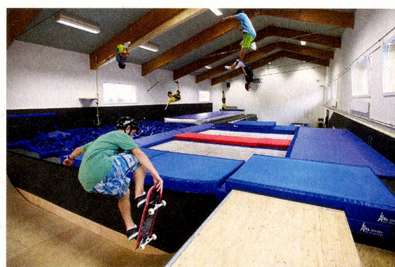
La sala de coordinación, donde se ensayan los saltos

se forman los jóvenes deportistas que practican deportes de invierno, esos talentos que quizá ya en Sochi luchen por medallas olímpicas para Suiza.