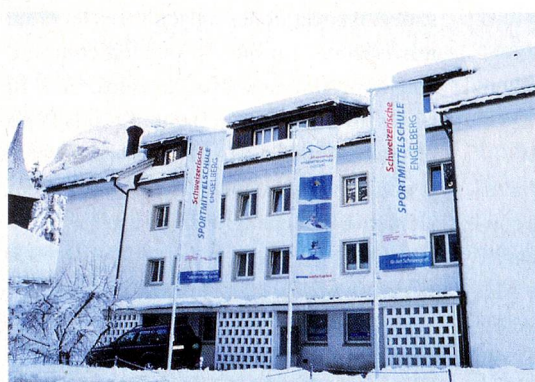
La escuela secundaria para deportistas en el antiguo aserradero del monasterio de Engelberg

Eskil Läubli no se puede quejar. La escuela, fundada en 1994, va viento en popa, se amplía continuamente pero no puede considerar todas las inscripciones, pese a que los padres de los jóvenes talentos deportivos tienen que pagar mucho: una plaza en esa escuela cuesta casi 14.000 francos al año. Los cantones de origen de los alumnos aportan otras contribuciones a través de los programas de fo-