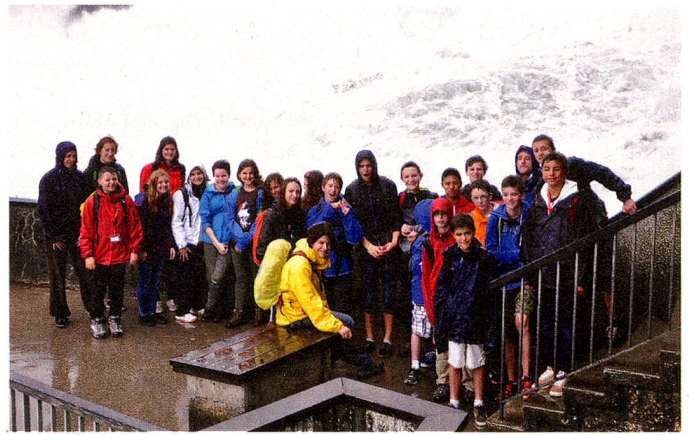
Jóvenes suizos del extranjero durante su viaje por Suiza en el verano de 2013