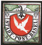
Caro ejemplar de coleccionista: «Basler Tauben» (paloma de Basilea), de 1845