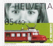
La estampilla de Pro Juventute de 2013 con recargo benéfico