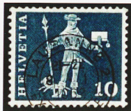
Desde 1960 se han emitido casi 1500 millones de esta estampilla de 10 rappens