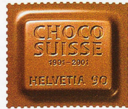
El «Choco Suisse» de 2001 huele a chocolate