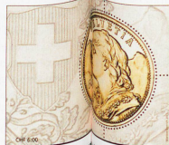
La estampilla de 6 francos «Goldvreneli», de 2013, con oro de 18 quilates