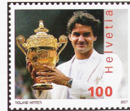
También las estrellas vivientes como Roger Federer están muy solicitadas para aparecer en las estampillas

ha invertido mucho más de 50.000 francos es «en gran medida invendible y carece de valor». El consejo del experto fue que sencillamente utilizara las estampillas de su colección aún sin franquear, y eso es lo que hace ahora Fiechter.