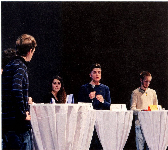
Jóvenes practican la argumentación política en el aniversario de la NSH

apoye el proyecto". La meta es disponer de un Centro Nacional para la Formación Política con una amplia base de apoyo y un contrato de prestaciones de la Confederación.