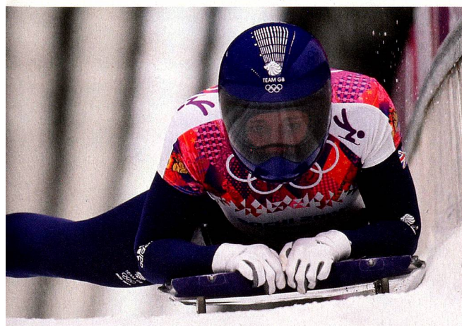
Olímpicos de Sochi: la ganadora de la medalla de oro, Elizabeth Yarnold (GB)

Los descensos en trineo, divertidos para grandes y pequeños, son fuertemente promovidos por las estaciones de esquí y los ferrocarriles de montaña