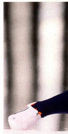
El skeleton en los Juegos

Es más fácil aprender a pilotar que a empujar, lo que explica que haya tantos atletas de sprint que practican este deporte. Pero al principio hay que trabajar mucho. Una vez en la pista lo que cuenta es tranquilizarse rápidamente para mantener la precisión. Lo que cuenta es la actitud mental, ya que cuanto más nervioso se pone quien