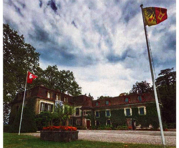
Château de Penthes

proyectos e iniciativas como por ejemplo, la restauración de la bandera de los Archivos Regionales de Nueva Helvecia en Uruguay.