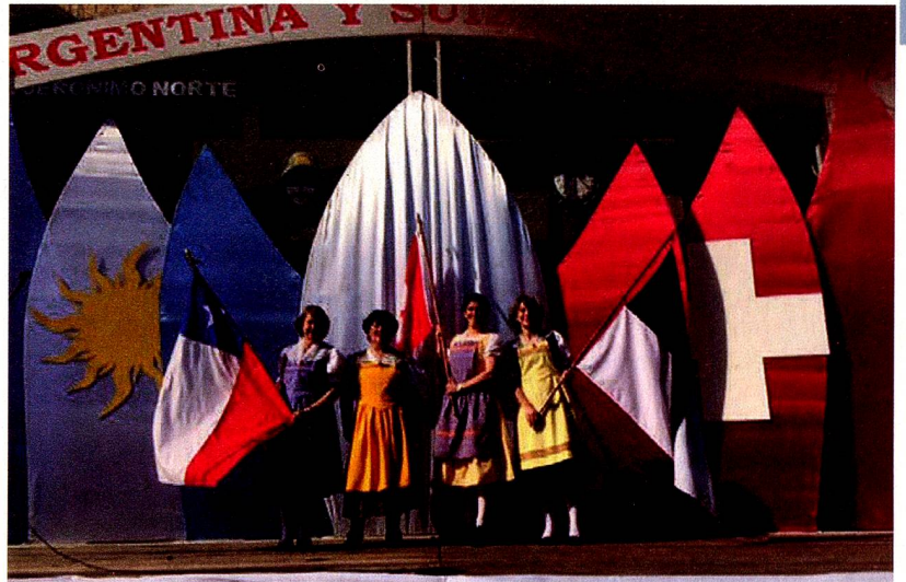
La delegación de Chile en el escenario principal

La Fiesta Nacional del Folclore Suizo se realiza anualmente, en el mes de junio y este año ha tenido una connotación especial ya que se enmarcó en el Bicentenario del ingreso del Cantón de Valais a la Confederación Helvética. Año jubilar para Suiza ya que tres cantones festejan en 2015 el ingreso a la CH de Ginebra, Neuchâtel y Valais. Además se concretó el "Hermanamiento" entre las Comunas de Brig-Glis (Wallis/Suiza) -origen de las familias que fundaron la colonia en el año 1858- y la Comuna de San Jerónimo Norte, coincidiendo también con la celebración de los 800 años de la fundación de la ciudad de Brig/Wallis.