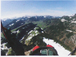
Parapentista en Alpestein

¿Quiere usted volar en Suiza? Nada más sencillo, porque el país está repleto de escuelas de vuelo, de clubs y de pilotos comerciales. Un día de prueba con un vuelo de 10 metros cuesta 120 francos, indica la FSVL. Para poder volar en parapente se necesita un carnet de vuelo, que en general se consigue en un año, y la idea es poder volar en varios tipos de condiciones meteorológicas, según esta federación. La formación cuesta unos 1800 francos y el material completo cerca de 5000 francos. Está prohibido volar sin carnet de vuelo, y la formación suiza es "detallada y cuidadosa", afirma Christian Jähr.