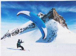
El speed flying sólo está permitido en pocos lugares