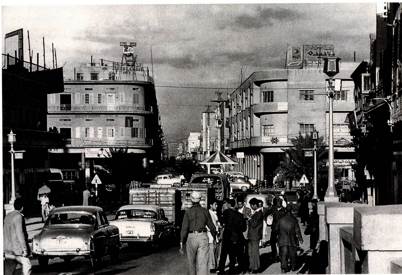
La Rashid Street en Bagdad, en 1956