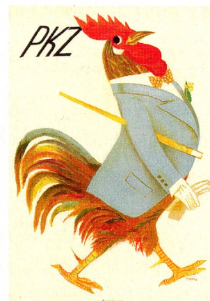
Cartel para PKZ (1935)