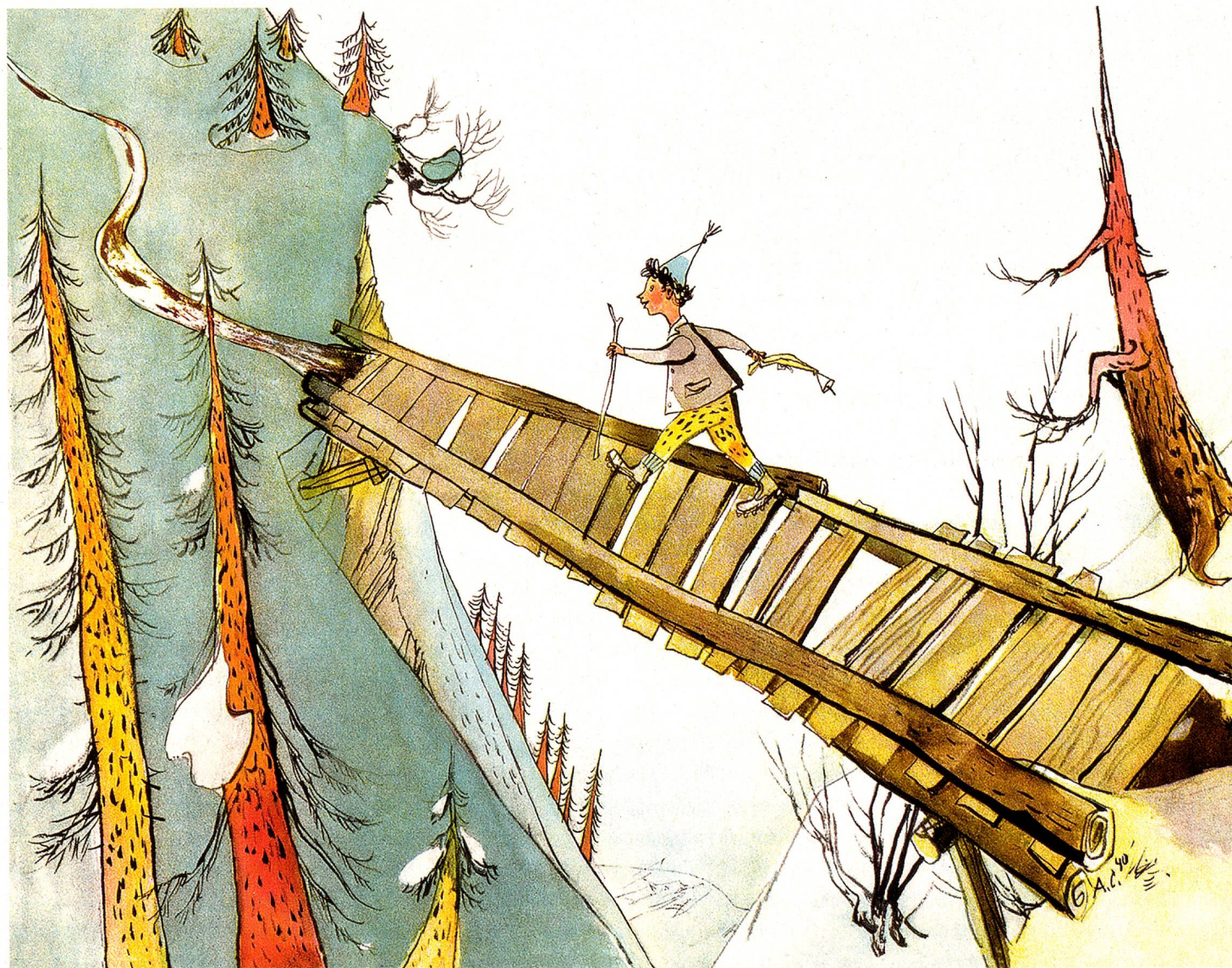
Schellen-Ursli de camino a la cabaña alpina