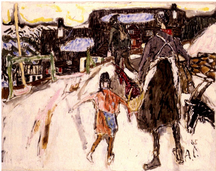
Familia de agricultores de alta montaña (1965), óleo sobre lienzo

“Allá arriba en las montañas, lejos de aquí, vive un chiquito como ustedes”. El libro que comienza con esta frase fue un éxito mundial. Desde 1945 se han publicado unos dos millones de ejemplares, y fue traducido a diez idiomas. El creador de «Schellenursli» es el pintor y diseñador gráfico Alois Carigiet – Selina Chönz escribió la historia. Desde hace varias generaciones, los padres suizos cuentan a sus hijos y nietos las historias de Schellenursli o de Flurina – en el extranjero, estas