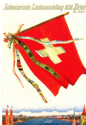
Cartel para la Exposición Nacional de 1939, celebrada en Zúrich