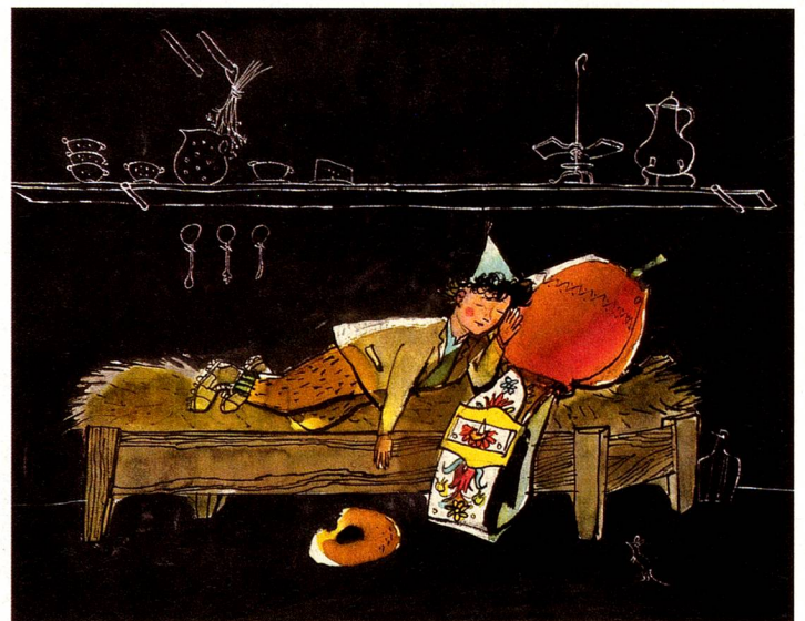
Ilustración de “Schellen-Ursli”