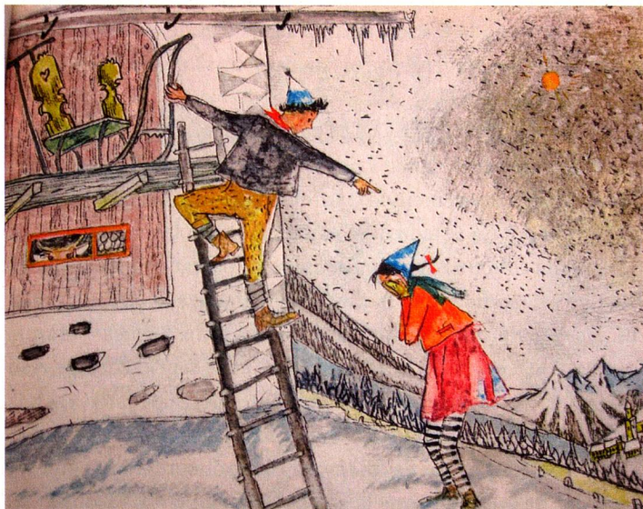
Ilustración del libro «Flurina und das Wildvöglein» (Flurina y el pajarillo silvestre)

historias han contribuido a afianzar el estereotipo de la imagen idílica de las montañas suizas.