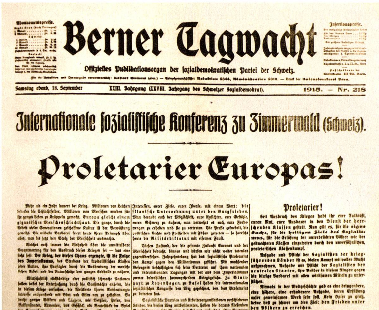
Informe en el periódico local de los socialdemócratas

clóricos de base de Zimmerwald con bossa nova, swing, latin y funk.