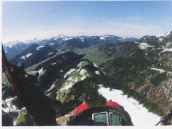
Parapentista en Alpestein

¿Quiere usted volar en Suiza? Nada más sencillo, porque el país está repleto de escuelas de vuelo, de clubs y de pilotos comerciales. Un día de prueba con un vuelo de 10 metros cuesta 120 francos, indica la FSVL. Para poder volar en parapente se necesita un carnet de vuelo, que en general se consigue en un año, y la idea es poder volar en varios tipos de condiciones meteorológicas, según esta federación. La formación cuesta unos 1800 francos y el material completo cerca de 5000 francos. Está prohibido volar sin carnet de vuelo, y la formación suiza es "detallada y cuidadosa", afirma Christian Jöhr.