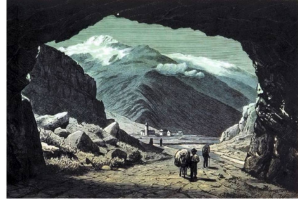
Panorama Suizo / Agosto de 2016 / NP4

Una ilustración romántica del Urnerloch, el primer túnel carretero de los Alpes.