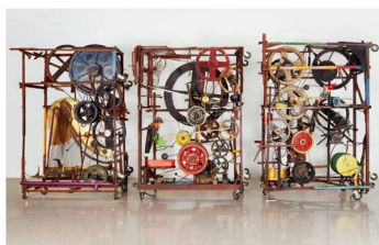
La primera máquina musical de la serie de cuatro "Méta-Harmonie" se remonta al año 1970.

1, 3, 4, 5: © 2016, ProLitteris, Zurich, Photo: Maxime Tinguely, Basel, David Spier 2: © 2016, ProLitteris, Zurich, Photo: maxime - Museum moderner Kunst Stiftung Ludwig Wien