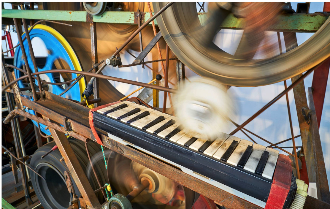
Rodando sobre las teclas: la dinámica de las obras sonoras de Tinguely a menudo sólo se aprecia en los detalles.