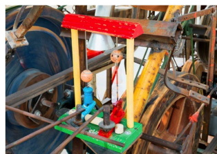
Los objetos más cotidianos pueden integrarse en las máquinas musicales de Tinguely.