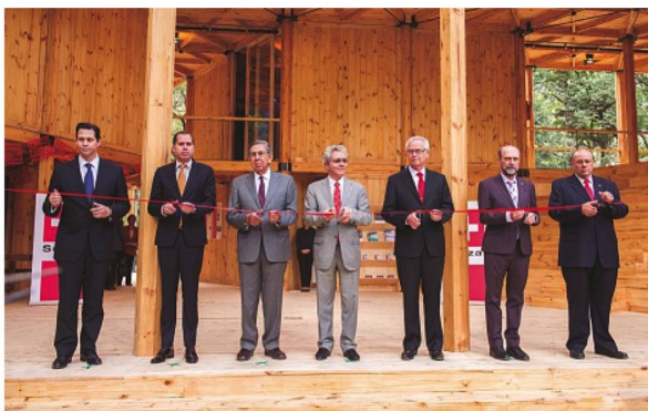
Los CEOs de las empresas patrocinadoras inauguran la Casa de Suiza México 2016

concluyó que “...además de ser el octavo inversionista directo más importante en México, Suiza es un socio privilegiado en materia de negocios y política multilateral. La Casa de Suiza México 2016 fue el foro ideal para una mayor profundización de la cooperación entre ambos países”.