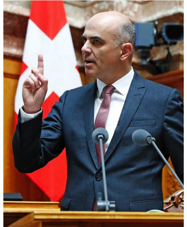
Dentro de poco el Consejero Federal Alain Berset podría lograr imponer "su" reforma.

El Ministro de Asuntos Sociales, Alain Berset (PS), puede ahora figurar en los anales de la historia como el Consejero Federal que ha logrado la primera revisión del AHV/AVS desde los años 90, consolidando así al segundo pilar al reducir la tasa de conversión, decisiva para establecer el monto de las pensiones. Todavía en 2010, el pueblo rechazó con un 72% de los votos la reducción de la tasa de conversión. Por eso,