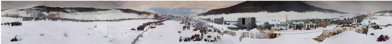
El cuadro panorámico Bourbaki de Lucerna, en todo su esplendor: esta pintura circular de Edouard Castres al natural mide 112 metros de largo.