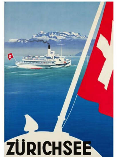
"Lago de Zürich", 1935.