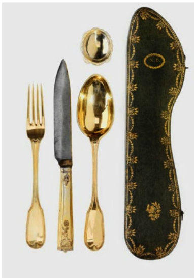
Así de elegantes podían ser los cubiertos en 1790, en la mesa de la clase adinerada.