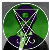
ZEAL & ARDOR: "Devil is Fine" (Radicalis).

Fue enorme el bombo publicitario en torno a este proyecto musical, ya antes de que existieran grabaciones. El músico basiliense Manuel Gagneux se preguntó cómo sonaría una mezcla de canciones de esclavos africanos y góspel junto con black metal, una mezcla hasta entonces inconcebible. Fue una broma, al la que Gagneux sin embargo se dedicó con ahínco.