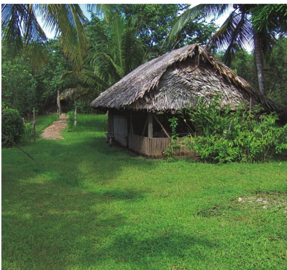
Vista del rancho comedor