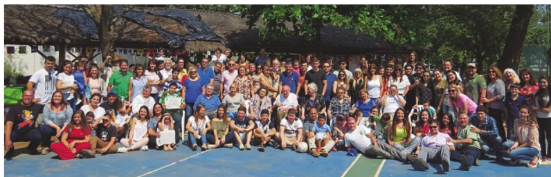
XXIII Encuentro Familia Schaerer