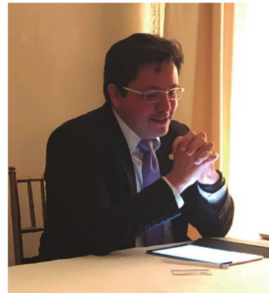
Sr. Julio Héctor Estrada Domínguez, Ministro de Finanzas Públicas,