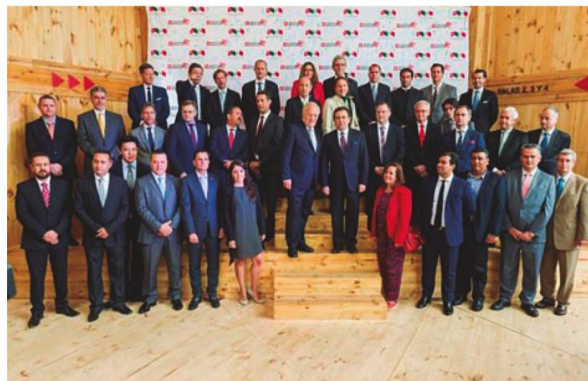
Inauguración de la Cámara con el Consejero Federal Schneider-Amman y el Secretario de Economía Guajardo en la Casa de Suiza

Durante los últimos doce meses se han constituido comités temáticos de trabajo que reúnen a representantes de empresas suizas y tratan temas como finanzas, educación, formación dual, responsabilidad social y ética, comercio exterior, energía y sustentabilidad, propiedad intelectual, salud e innovación y seguridad. La Cámara desarrolló un Código de Ética y Conducta, el cual define los valores que rigen el comportamiento ético de las empresas afiliadas. Este documento ayudará a las empresas afiliadas a conducir sus negocios de manera responsable con ética y legalidad en todo