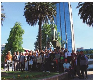
Alcalde de Temuco y Embajador en Suiza Inauguración Plaza Suiza