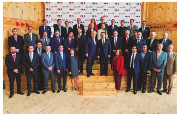
Inauguración de la Cámara con el Consejero Federal Schneider-Amman y el Secretario de Economía Guajardo en la Casa de Suiza

Durante los últimos doce meses se han constituido comités temáticos de trabajo que reúnen a representantes de empresas suizas y tratan temas como finanzas, educación, formación dual, responsabilidad social y ética, comercio exterior, energía y sustentabilidad, propiedad intelectual, salud e innovación y seguridad. La Cámara desarrolló un Código de Ética y Conducta, el cual define los valores que rigen el comportamiento ético de las empresas afiliadas. Este documento ayudará a las empresas afiliadas a conducir sus negocios de manera responsable con ética y legalidad en todo