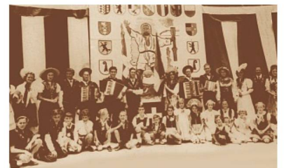
1- Fiesta Suiza 1º de agosto 1920 2- Día de campo en el Desierto de los leones-Julio 1922 3- 1º de agosto 1947