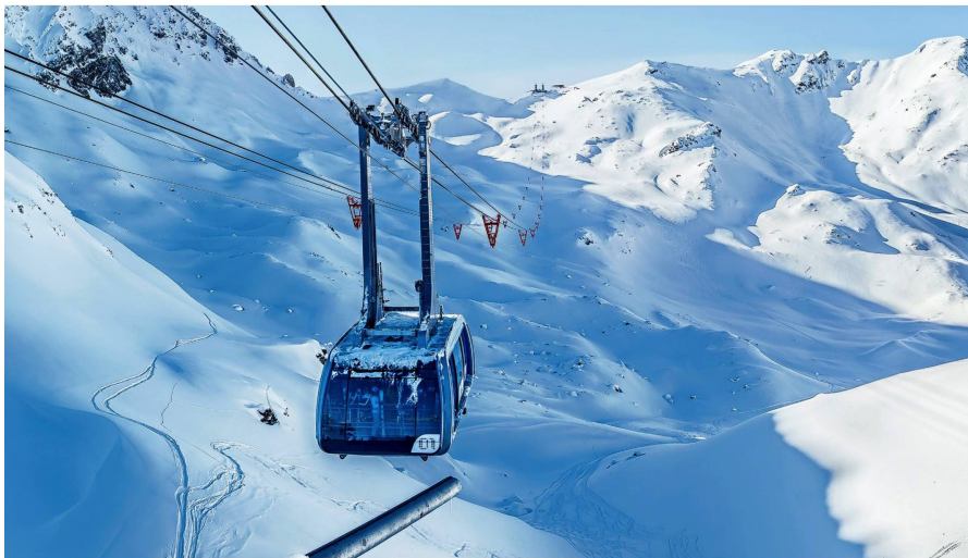
El teleférico "Urdenbahn" de Arosa y Lenzerheide es el más rápido de Suiza. Este teleférico sin torres conecta desde 2014 dos estaciones de esquí, sin necesidad de abrir nuevos pistas. Foto de la región turística de Lenzerheide.