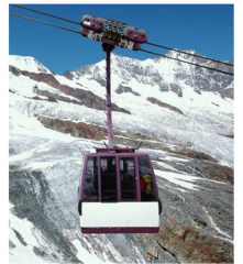
Otra innovación: el primer teleférico del mundo suspendido de tres cables comunica desde 1991 Saas-Fee con la cima de la montaña.