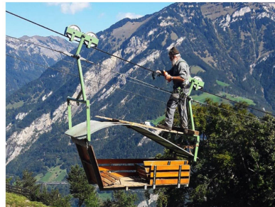
Para muchas familias y granjas alpinas en la Suiza central, los pequeños teleféricos son un medio de transporte indispensable, como el "Bärchibahn" de Isenthal, en funcionamiento desde 1979.