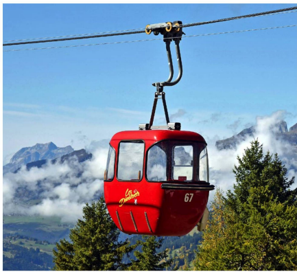
Las telecabinas Giovanola de color rojo vivo de los años setenta estuvieron en funcionamiento hasta abril de 2017. La Oficina Federal de Transportes no volvió a renovar la concesión, sin embargo, está prevista su sustitución por otro tipo de teleférico.