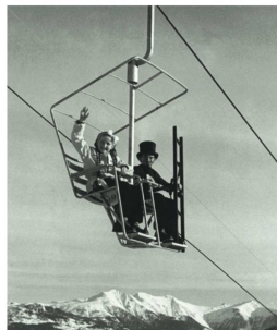
Estos dos «pasajeros de la suerte» inauguraron el primer telesilla desembragable del mundo, el 16 de diciembre de 1945 en Flims.