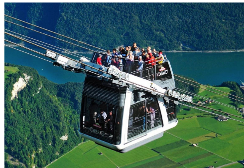
Una novedad mundial fabricada en 2012: un descapotable en el Stanshorn de Nidwalden.