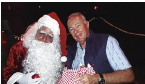
Samichlaus y el Embajador Hans-Ruedi Bortis

Durante su primer año de actividad, la Cámara organizó eventos de intercambio informativo con el Ministro de Fi-