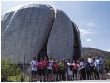
El grupo frente al Templo Bahá'í

deportivo-recreativa se realiza con dos bastones, diseñados con tecnología específica para la disciplina, lo que permite desarrollar un ejercicio efectivo y eficaz en todo el cuerpo, mejorando la fuerza muscular, el sistema cardiovascular, la coordinación y la movilidad.