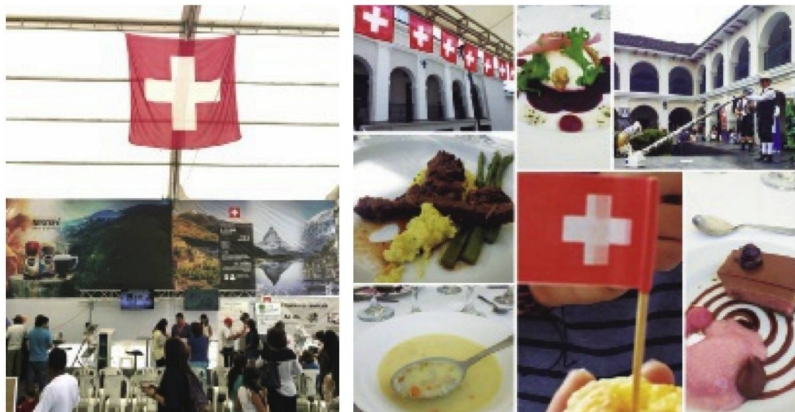
Stand de Suiza en Popayán