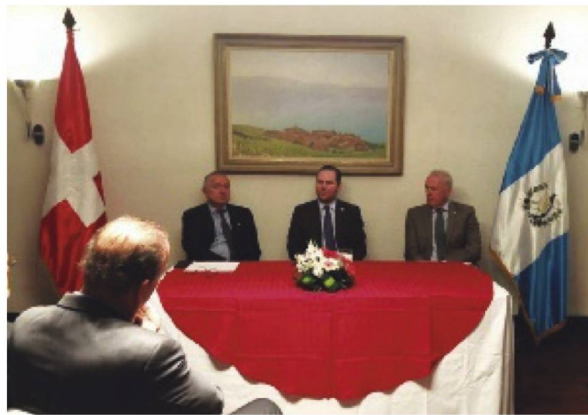
Evento con el Presidente del Congreso Sr. Álvaro Arzu