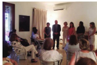
Asamblea General Damas Suizas

Con la doble finalidad de reunir a la Comunidad y realizar un trabajo be-