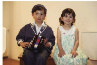
Actuación del Grupo musical inter-clubes