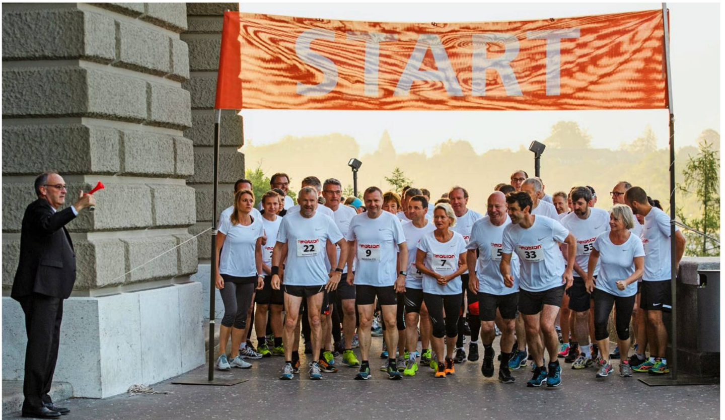
Cada año, los consejeros participan en la tradicional carrera alrededor del Palacio Federal; pero ahora inicia la carrera para ingresar al Palacio Federal.

Poco después de las elecciones de 2015, Guy Parmelin fue elegido por el Parlamento como segundo miembro de la UDC para formar parte del gobierno federal. De ese modo, los cuatro partidos principales volvieron a estar debidamente representados en el Consejo Federal (dos miembros de la UDC, dos del Partido Socialista Suizo, dos del Partido Liberal Radical, uno del Partido Demócrata Cristiano), poniendo fin por el momento a las disputas de los últimos años por los escaños en el Consejo Federal. Además, el giro a la derecha en las elecciones al Consejo Nacional no provocó una conmoción tan fuerte del panorama político como se había vaticinado. El bloque ciudadano obtuvo más votos en el Parlamento que antes y marcó el rumbo de la política financiera y social. Así, el Parlamento protegió el secreto bancario dentro del país y auto-