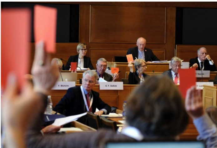
Entre los múltiples aspectos que abordó en Berna, el CSE se centró principalmente en el año electoral.

Por primera vez en su historia, el CSE decidió en Berna emitir recomendaciones de voto; eso con el fin de que la próxima legislatura tenga más en cuenta los deseos y necesidades de las suizas y suizos en el extranjero. En la siguiente sesión del CSE, que se celebrará el 16 de agosto de 2019 en Montreux, se tomarán decisiones concretas acerca de las recomendaciones de voto.