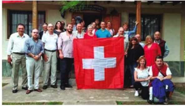
Delegados de las asociaciones de FASRA frente a la Casa Suiza Sigriswil