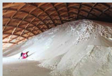
La cordillera secreta de Suiza: dentro de la cúpula de almacenamiento de sal en Riburg, Argovia.

La Embajada de Suiza y el Centro Consular Regional, les desean Felices Fiestas y un próspero Año Nuevo