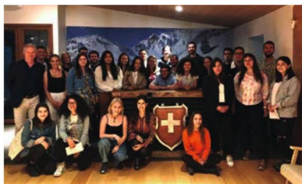
Jóvenes suizos de Chile y Argentina en el Club Suizo de Santiago