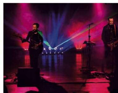
Grupo musical STEVANS

(EDITA VOKRAL-EMBAJADORA DE SUIZA EN BOLIVIA)