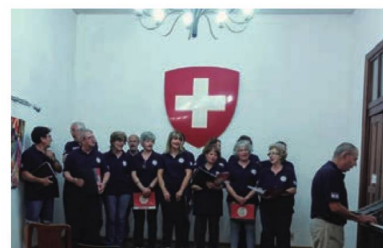
Coro Suizo en la Sociedad Suiza