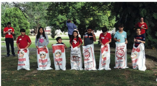
Fiesta de Navidad: carrera con sacos