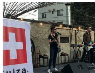
Imagen de la Feria "Pueblo de la Francofonía"