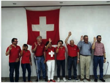
Nueva Junta Directiva electa para 2019-2020