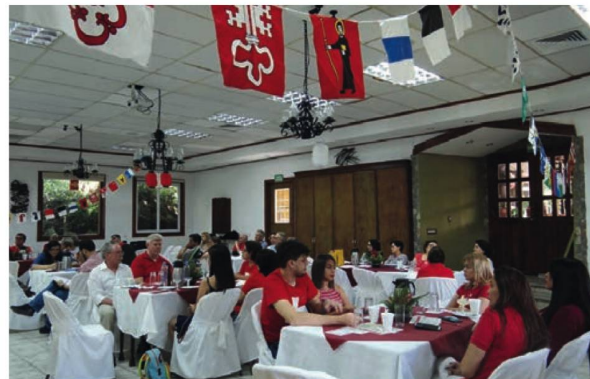
Asamblea realizada en agosto de 2019

a) Promover y mantener un mayor y permanente acercamiento, solidaridad, armonía, amistad, cooperación y beneficio mutuo entre los miembros de la colectividad suiza, descendientes de los suizos y personas con nexos con Suiza y/o con ciudadanos suizos radicados en la República de Honduras.