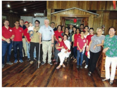
Festejo Día de la Madre

cioeconómico y cultural de Honduras y sus habitantes.