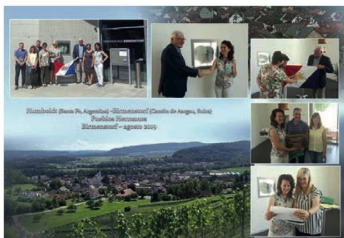
Birmenstorf 2019 y St. Nicklaus 2019