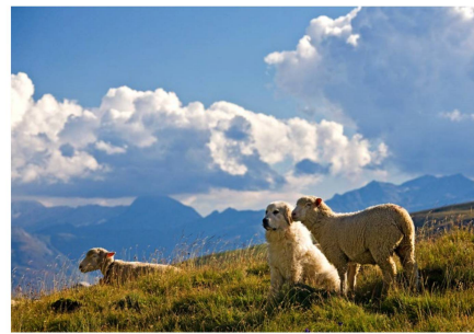
Un perro pastor ovjero, de la raza Maremmiano Abruzzese, vigila ovejas en un pasto de alta montaña de los Grisones.

Los lobos mataron entre 1999 y 2018 a casi 3 700 animales, según indica una estadística de KORA, fundación para la ecología de los depredadores y la gestión de la fauna silvestre que, por encargo de la Confederación, supervisa la evolución de las poblaciones de depredadores y sus consecuencias. Los criadores perjudicados reciben de la Confederación y de los cantones indemnizaciones por los animales presa de los lobos. En el futuro, sin embargo, sólo se pagarán los daños si los animales han estado protegidos de forma adecuada, por ejemplo, mediante cercas eléctricas y perros especialmente entrenados que vigilan los rebaños de ovejas en los Alpes y los defienden contra los lobos. La Confederación subvenciona estas