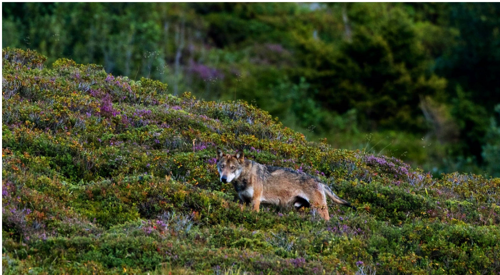
En agosto de 2006, el fotógrafo naturalista Peter A. Dettling logró tomar esta foto de un lobo salvaje en el distrito de Surselva; es una de las primeras fotografías que no se tomaron con una cámara trampa.