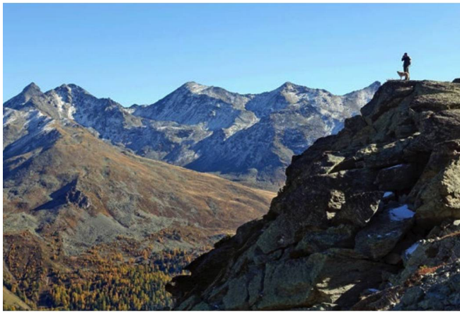
Observando lobos en el Valais: foto de la película "Die Rückkehr der Wölfe" ["El regreso de los lobos"], de Thomas Horat.

medidas de protección con casi tres millones de francos al año.