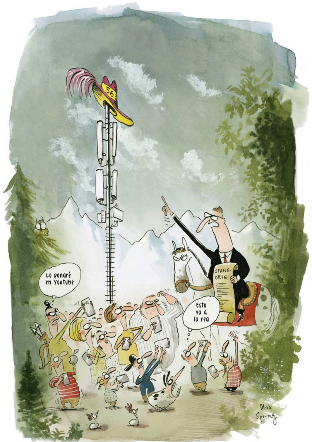
Caricatura de Max Spring para “Panorama Suizo”

Al mismo tiempo, el 5G permitiría impulsar la innovación tecnológica en Suiza. Según afirman sus promotores, gracias a este flujo de datos ultrarrá-