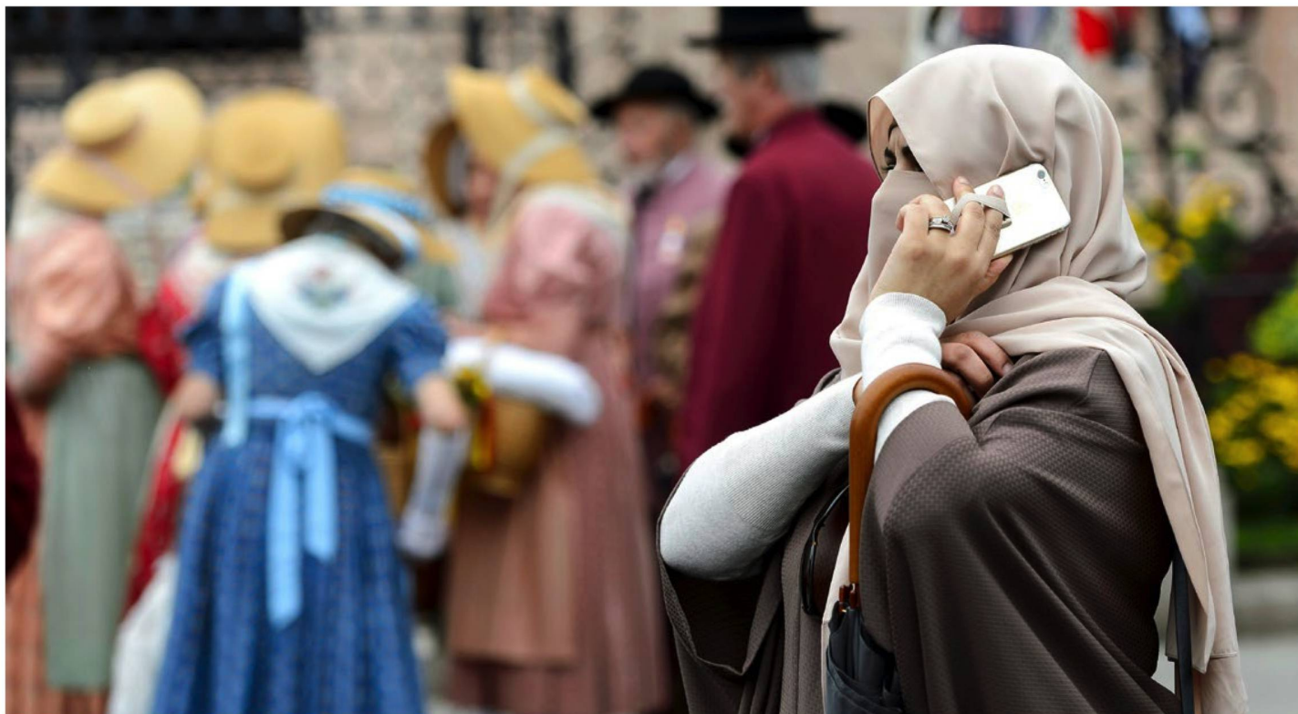
Una turista con velo integral se topa en Ginebra con un grupo folclórico local: el Comité de Egerkingen desea prohibir este tipo de encuentros.