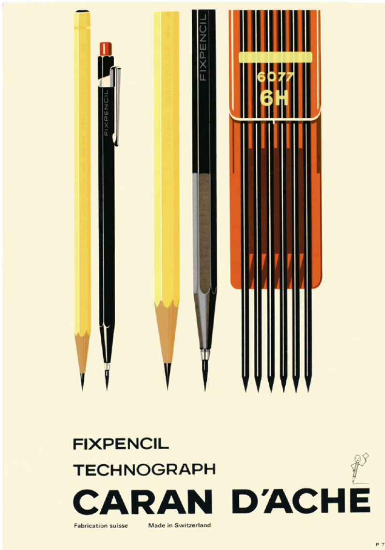
En 1930, la empresa patentó el primer portaminas del mundo. El "Fixpencil" obtuvo gran éxito, sobre todo entre los diseñadores técnicos