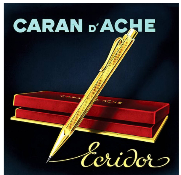
Con su toque lujoso, el bolígrafo hexagonal "Ecrivor" fue todo un éxito: a partir de 1953 se vendieron millones de ejemplares