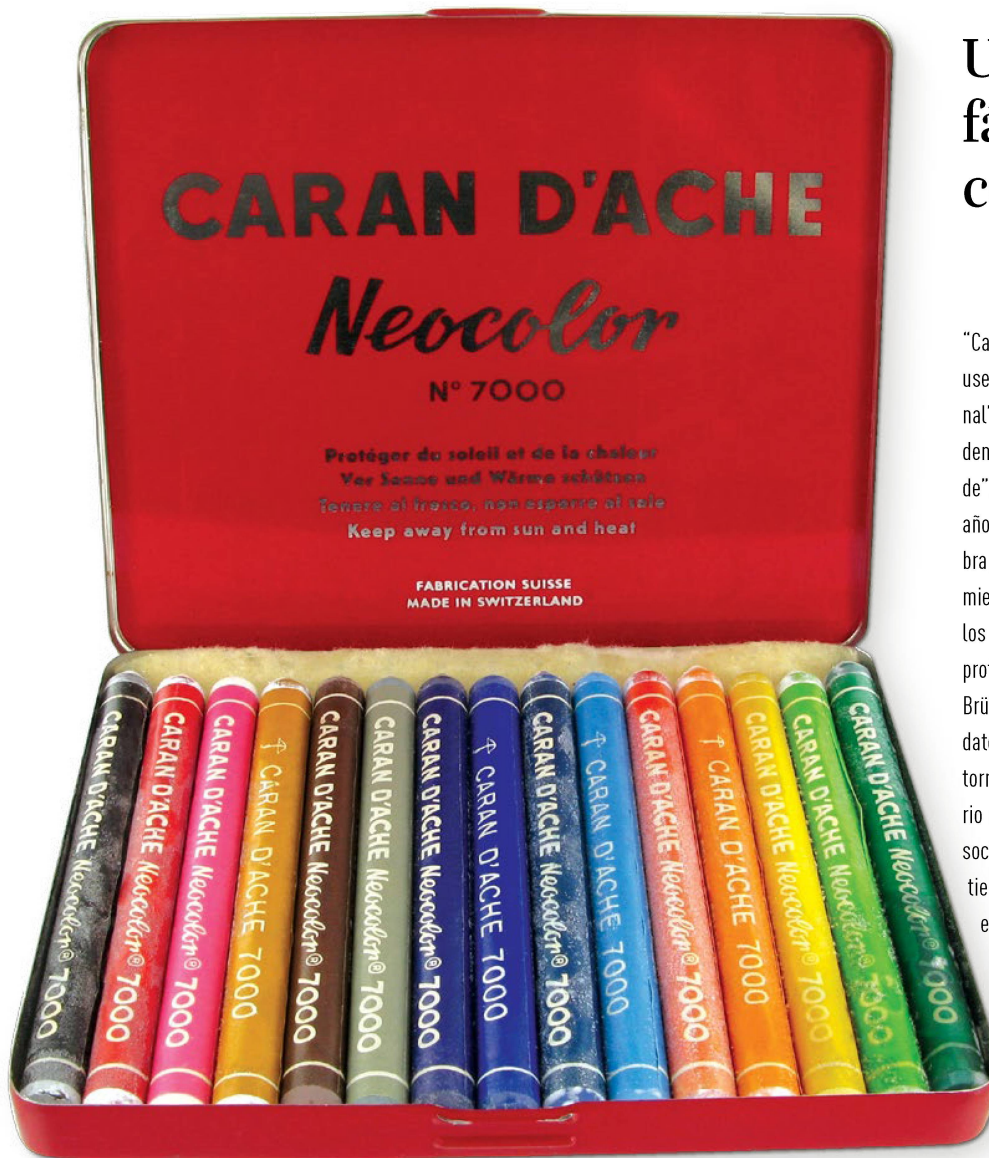
Los lápices de cera "Neocolor", para pintar al pastel, llegaron al mercado en 1952. Poco después, Pablo Picasso los usaría para realizar sus esbozos