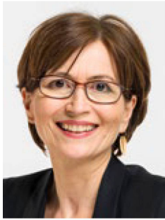
Para la Consejera Nacional Regula Rytz, se trata de “un intento de acallar a la ciencia portadora de malas noticias”.