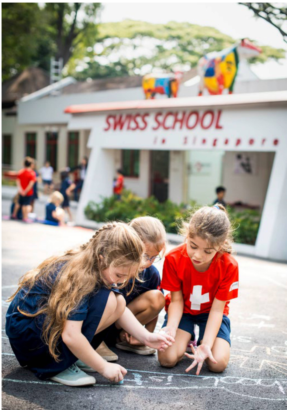
Alumnas jugando durante el recreo en la escuela familiar suiza de Singapur.

La Confederación apoya las 18 escuelas suizas oficialmente reconocidas en el extranjero. Éstas no sólo difunden la educación suiza en todo el mundo, sino que contribuyen a visibilizar la presencia cultural suiza en el extranjero, fomentando así una mejor comprensión de nuestro país, nuestras tradiciones y nuestros valores.