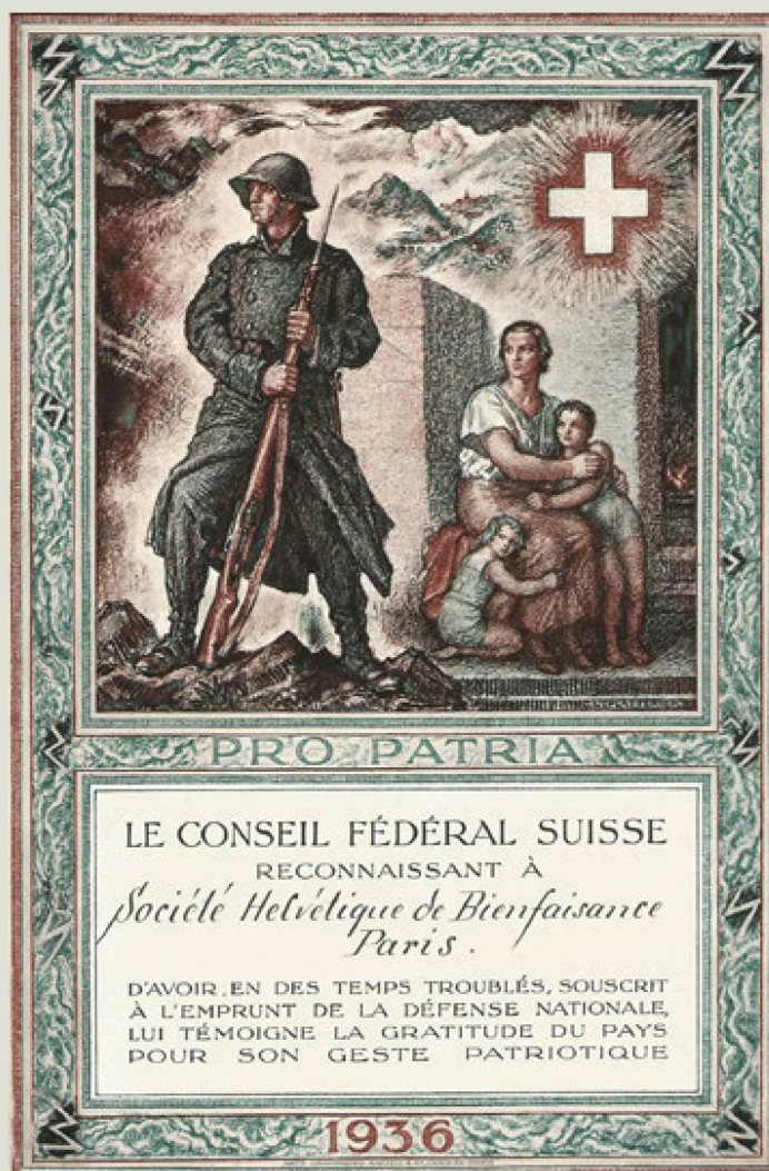
Un documento histórico de un periodo turbulento: en 1936, el Consejo Federal agradeció a la Sociedad Helvética de Beneficencia de París por su compromiso y expresó "la gratitud del país por su gesto patriótico".