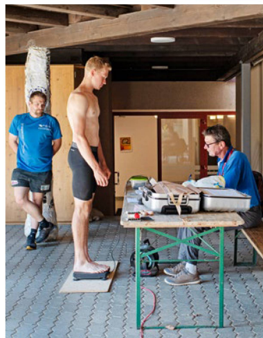
Antes del torneo se comprueba el peso de cada equipo.