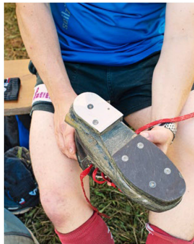
Zapatos especiales para tirar de la soga: se permite una placa metálica en el talón.